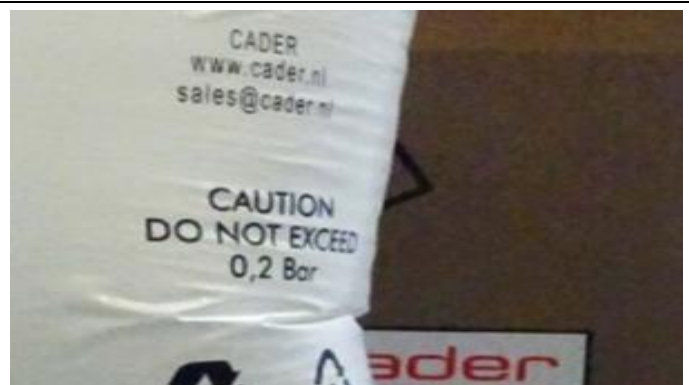
oder auf dem Staupolster angegeben