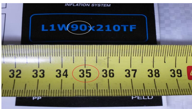
Staupolsterbreite 90cm für Lücke von 35cm max.