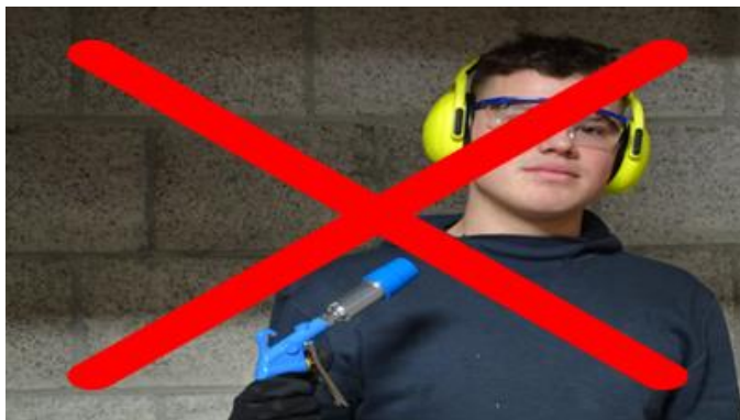
Das Füllpistol nie auf Gesicht oder Körper richten