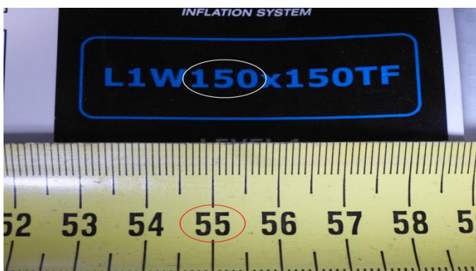
Staupolsterbreite 150cm für Lücke von 55cm max.