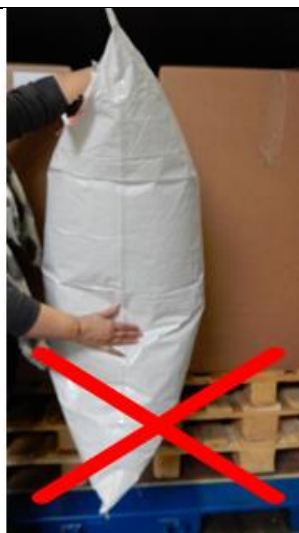
Bereits gefüllte Staupolster nicht zwischen die Ladung platzieren