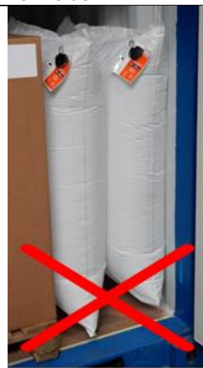
Nicht zwei oder mehrere Staupolster einsetzen um eine Lücke zu füllen

Wenn Sie den Staupolster erneut verwenden möchten, überprüfen Sie ihn bitte sorgfältig