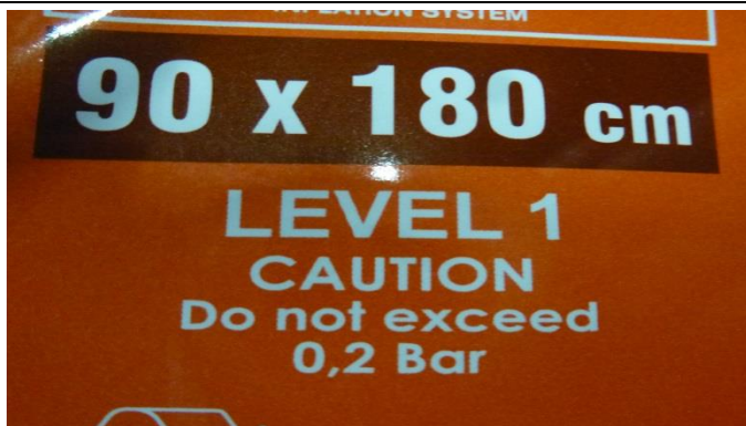
Der Betriebsdruck ist auf den Etikett