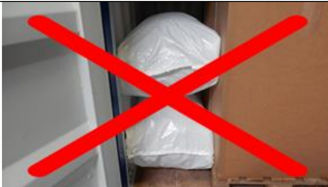
Staupolster nicht horizontal einsetzen