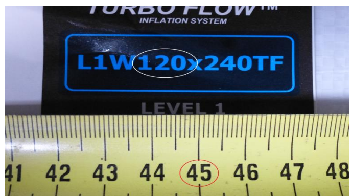
Staupolsterbreite 120cm für Lücke von 45cm max.