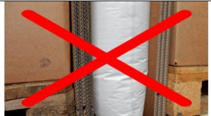
Verwende Puffermaterial um scharfe Kanten zu vermeiden