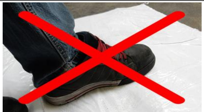
Nicht auf Staupolster treten