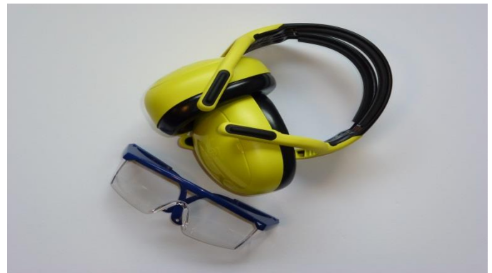
Schutz der Augen und Ohren wird dringend empfohlen