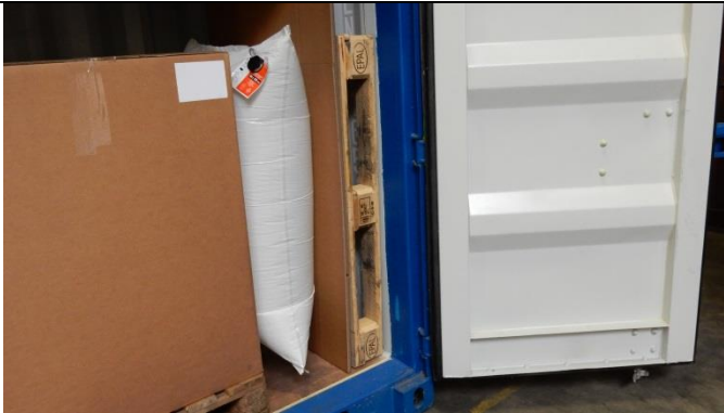
Wenn das Raum zu groß ist, Puffermaterial einsetzen